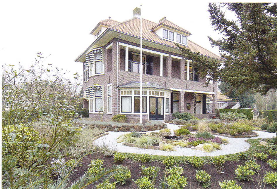
Nieuwe 's Gravelandseweg 40

Bussum, het kan niet afgedaan worden met een paar algemeenheden. Als liefhebber van de 'belle époque' - de periode tussen 1880 en 1914 - gaat mijn interesse en vermoedelijk ook de uwe, uit naar het markante gebouw in onze villawijk het Spiegel.