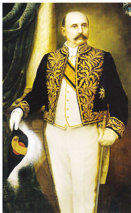
Generaal J.B. van Heutsz

Aan de Nieuwe 's Gravelandseweg 40 op de hoek met de Middenlaan staat een markante villa, die aan de noordzijde over de hele lengte een inpandig balkon heeft. Het doet denken aan de brug van een stoomschip uit het begin van de 20e eeuw; alle lijnen van het gebouw zijn strak en voornaam. De villa werd gebouwd voor een historisch figuur uit de Nederlandse geschiedenis; de befaamde/berechtigde generaal J.B. (Joannes Benedictus) van Heutsz (Coevorden, 3 februari 1851 – Montreux, 11 juli 1924), ook wel "De Pacificator van Atjeh" genoemd en een van de weinigen die werd onderscheiden met de Koninklijke Willemsorde. Een artikel over de man zelf is iets voor het blad van de Historische Kring