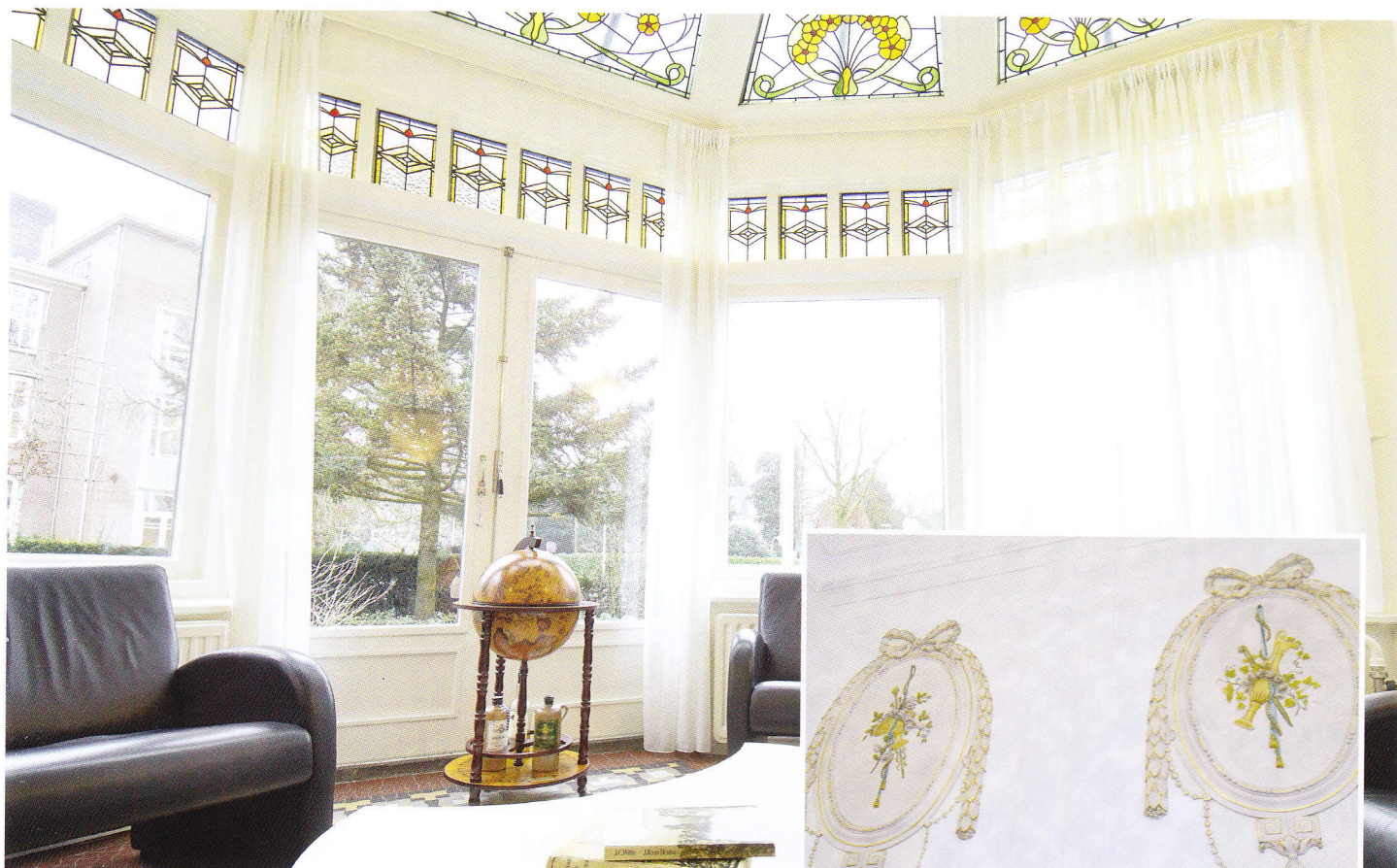
De serre van de villa Van Heutz.

De firma Röbbke pakte de zaken grondig aan; zij lieten het dak renoveren en het hele gebouw van binnen en buiten schilderen. Ook werd de tuin opnieuw ingericht wat ondanks de bescheiden hoeveelheid grond aan de noordzijde van het gebouw nu een aanzienlijk ruimtelijker aanblik biedt. Tenslotte werden markiezen aangebracht en zie daar! Er staat een villa in volle glorie.